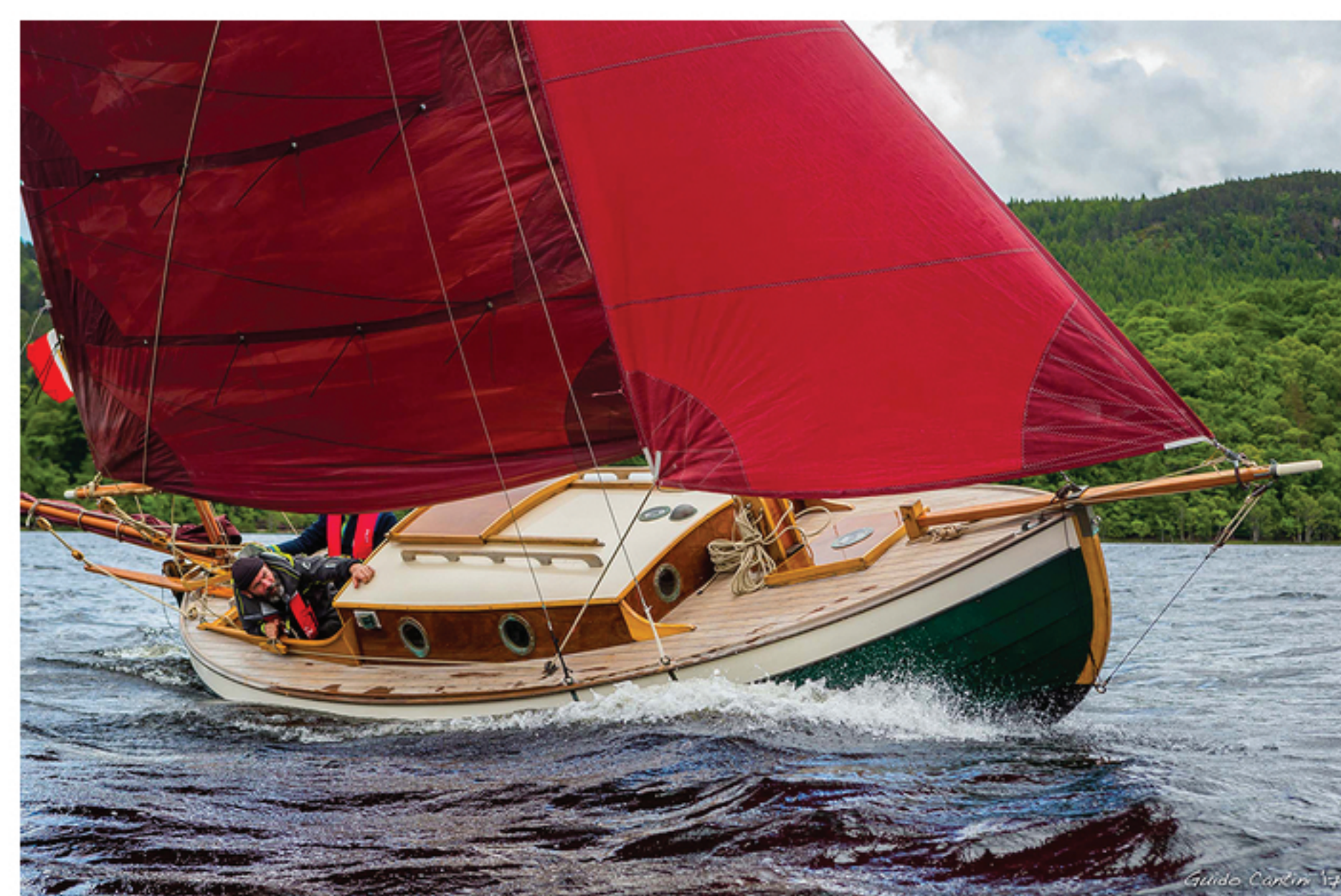
Fort William, Scotland, UK, 2017. Takatani naviga Loch Ness.

Con Takatani , una piccola barca a basso impatto acustico e ambientale, uno yawl progettato dall'inglese Iain Oughtred, l'equipaggio naviga a vela da ovest a est, lungo le acque interne scozzesi, percorrendo i 96 km e le 29 chiuse del canale di Caledonia , da Corpach nei pressi di Fort William sull'Oceano Atlantico, fino a Inverness sulla costa orientale scozzese sul mare del Nord, tra i paesaggi che il fotografo Guido Cantini ha reso in poetica bellezza. Si naviga avvistando castelli diroccati, tra i laghi, dal piccolo e affascinante Loch Oich al misterioso Loch Ness e Loch Lochy , uno dei più estesi, e le Highlands, scarsamente popolate e scenografiche, in un'avventura che sa di viaggio alla conoscenza di se stessi.