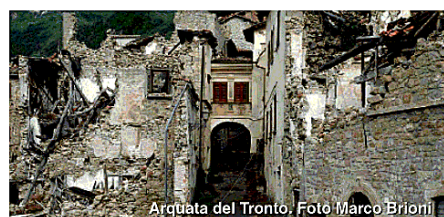
Arquata del Tronto.

"Ci siamo avvicinati a questi luoghi - spiegano gli artisti - nel massimo rispetto istituzionale ma soprattutto umano. La nostra priorità è stata sempre quella di raccontare, attraverso una documentazione secca ed asciutta, il dramma vissuto da queste persone. Un dramma causato indubbiamente dalla furia della natura a cui però si è innegabilmente aggiunta la beffa di uno stato incapace nel breve di affrontare situazioni emergenziali come questa. Nelle nostre immagini non si vedono persone, ma si "sentono" le loro storie. Come Antonio, proprietario dell'uni-