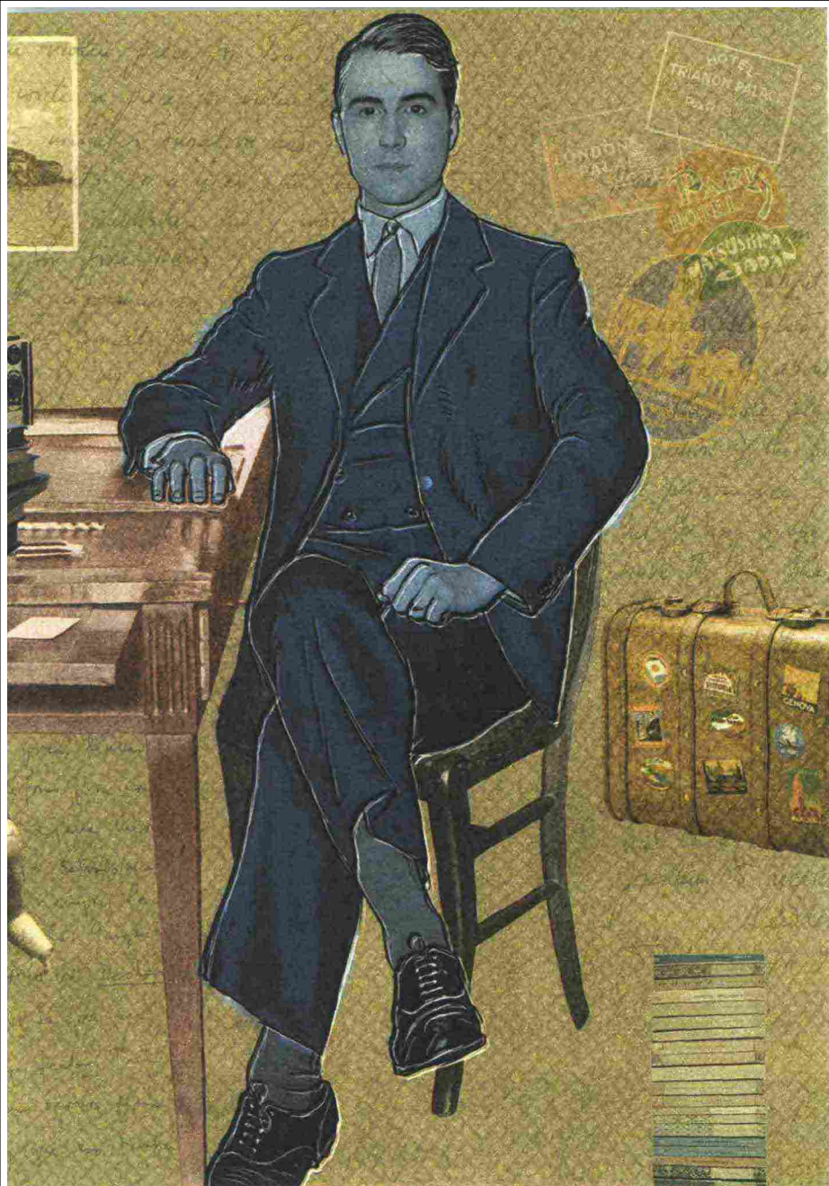
ILLUSTRAZIONE DI STEFANO SANI SCARPONI

sufficiente gettare uno sguardo tra le fenditure delle persiane per vedere che avevo ai miei piedi l'intera città». La vista delle circostanti colline «simili a spalle di gigante sotto il cielo azzurro» lo empiva di «una emozione straordinaria che lo faceva delirare», facendolo piombare «in uno stato prossimo alla follia». Il tempo passato a Genova segnò per lui l'inizio di una strana ebrietà, che doveva accompagnarlo per tutta la giovinezza. Per strada, con intimi ardori, scrutava sconosciuti coetanei. Nella sua mente si trasfiguravano in sensuali e conturbanti principi italiani del Rinascimento. Scriveva racconti ambientati a Genova. Uno dei suoi eroi, un giorno di bufera, si gettava dal terrazzo della casa di via della Crocetta e cadeva tra le tombe di Staglieno.