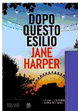
DOPO QUESTO ESILIO JANE HARPER

TROVALI PER PRIMO di Linwood Barclay, Nutrimenti, pp. 512, € 22. Dopo aver scoperto di avere una grave malattia genetica, un magnate del tech si mette alla ricerca dei figli biologici. Qualcun altro, però, è sulle loro tracce, e vuole ucciderli. Thriller post-tecnologico da leggere in spiaggia.