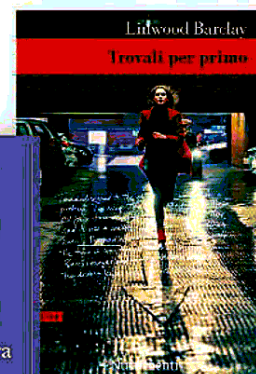
Linwood Barclay Trovali per primo