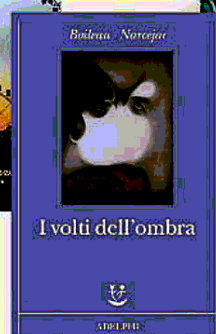
I volti dell'ombra