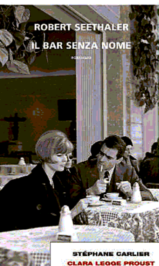
ROBERT SEETHALER IL BAR SENZA NOME